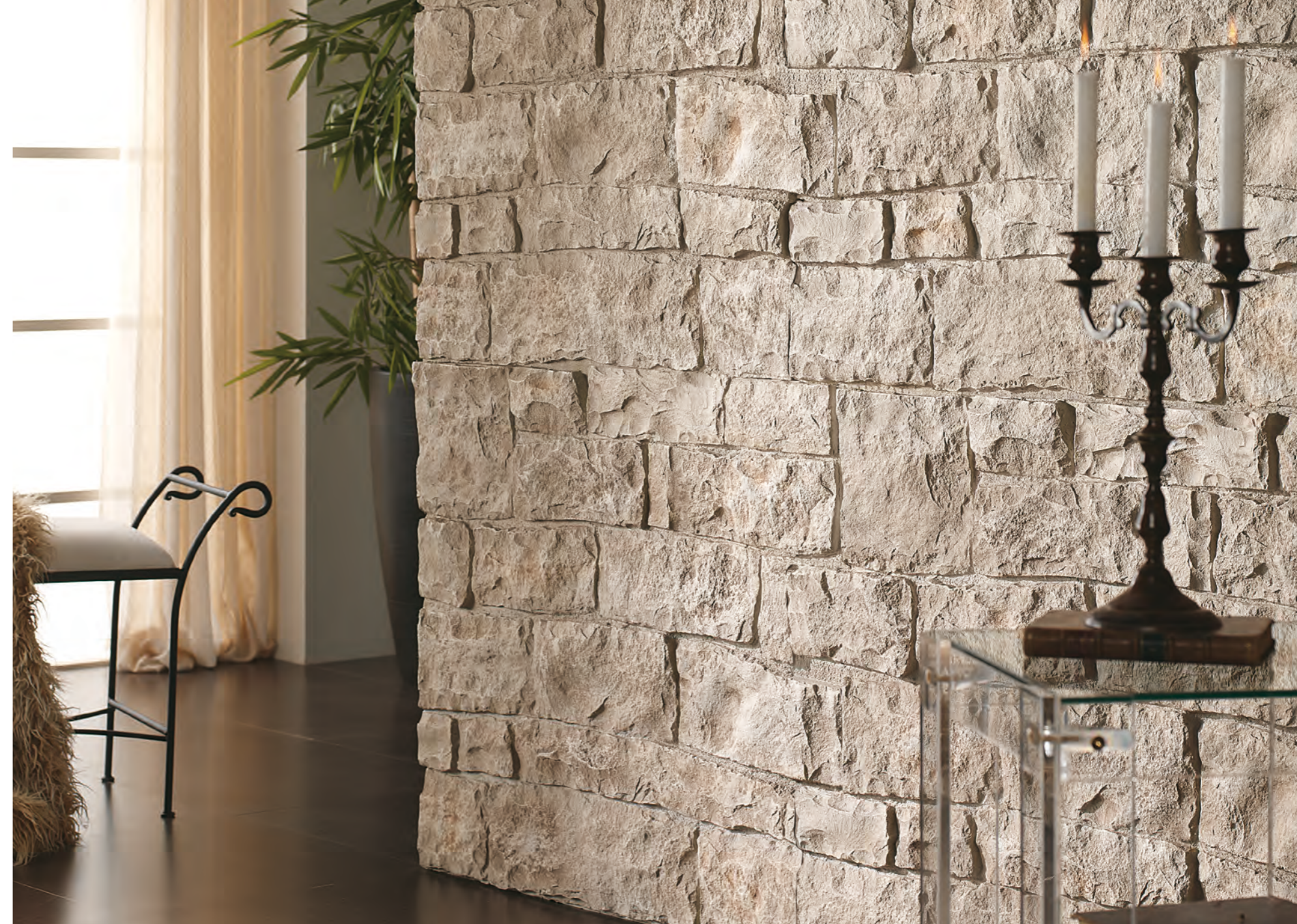
PR 52 Blanco Arena