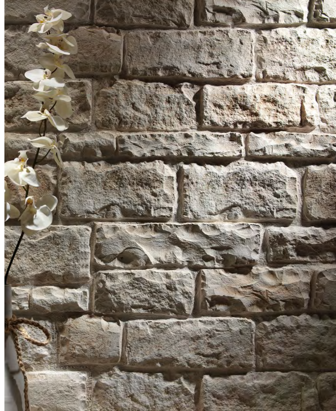
PR 52 Blanco Arena