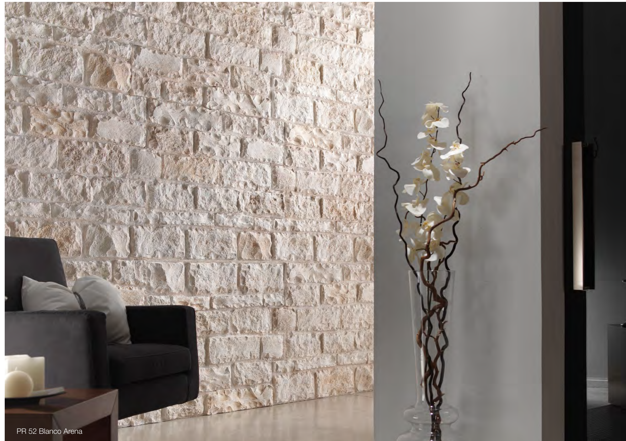
PR 52 Blanco Arena